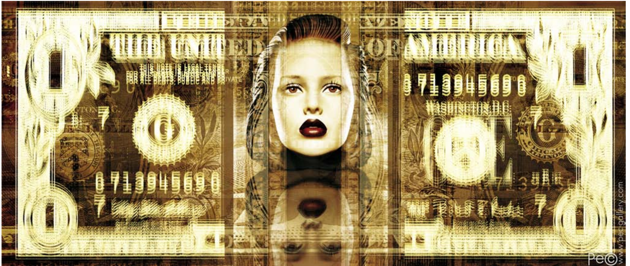
PAPER DOLL 001 (120x51CM.)