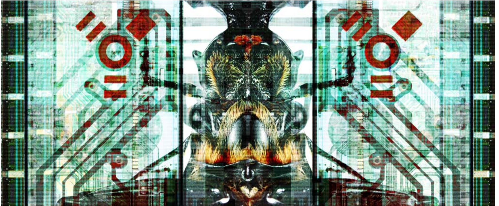
BUG IN THE SYSTEM 006-C (150x64CM.)