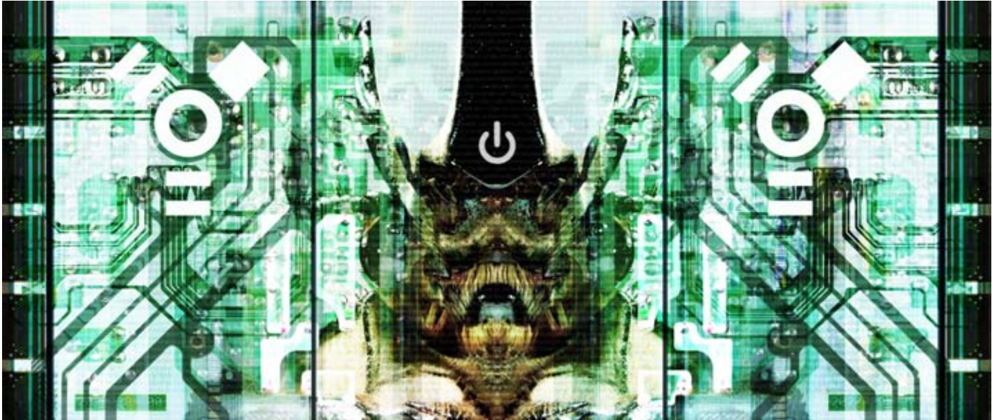
BUG IN THE SYSTEM 005 (150x64CM.)