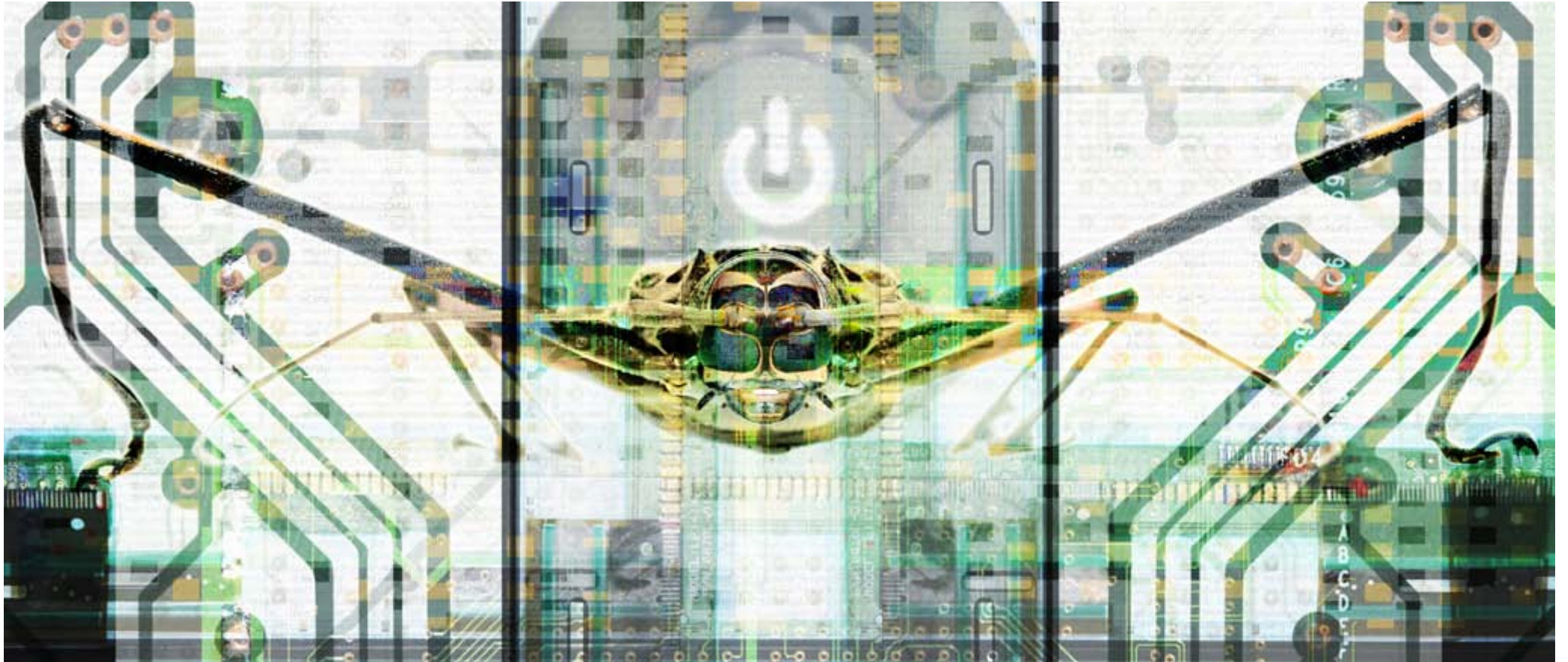
BUG IN THE SYSTEM 001 (150x64CM.)