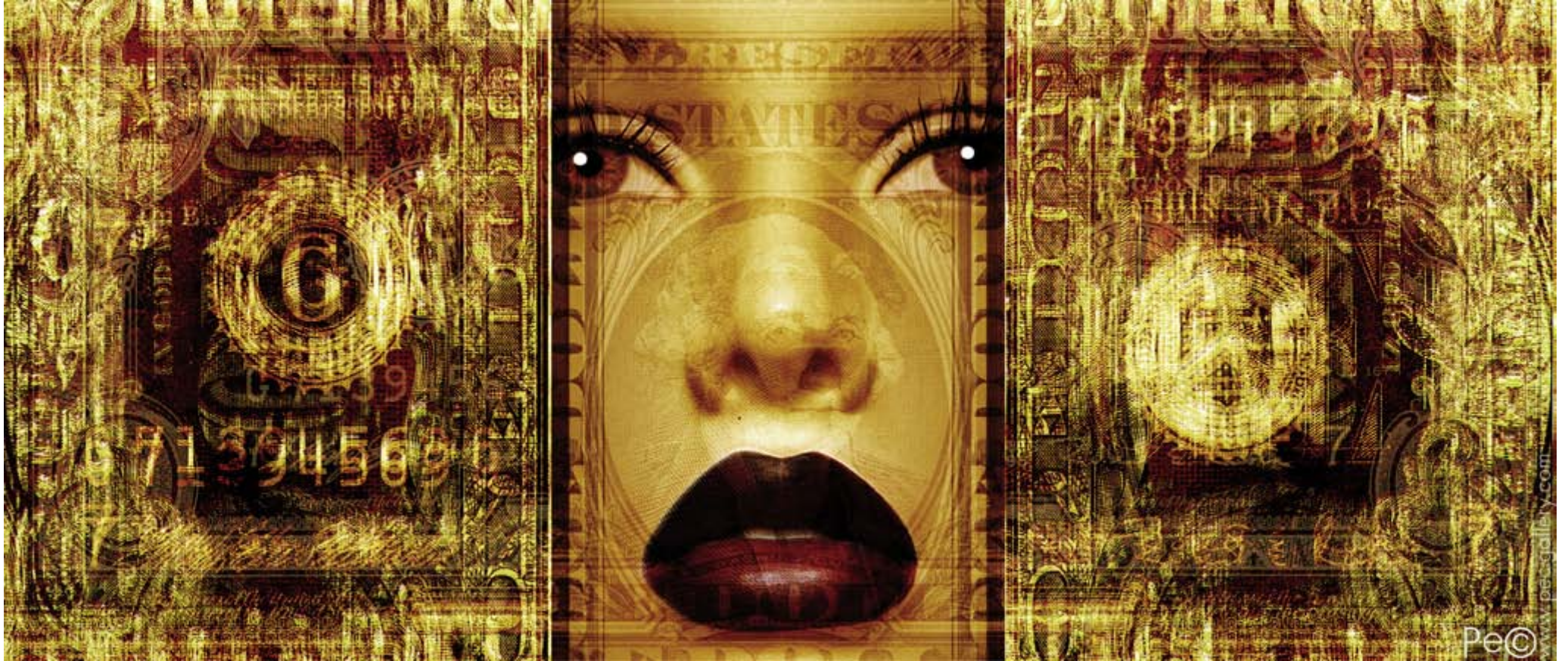
PAPER DOLL 007 (120x51CM.)