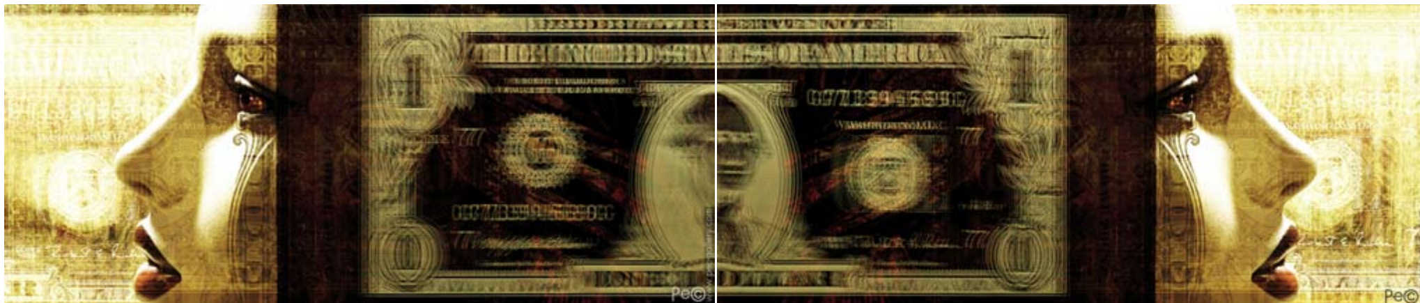
PAPER DOLL diptyque 001 (100x42,5 cm.)