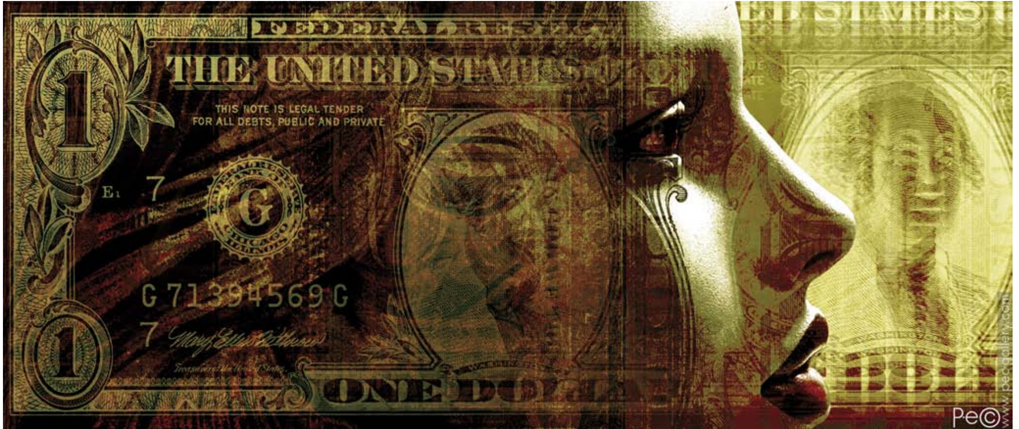
Pe© PAPER DOLL 010 (120x51CM.)