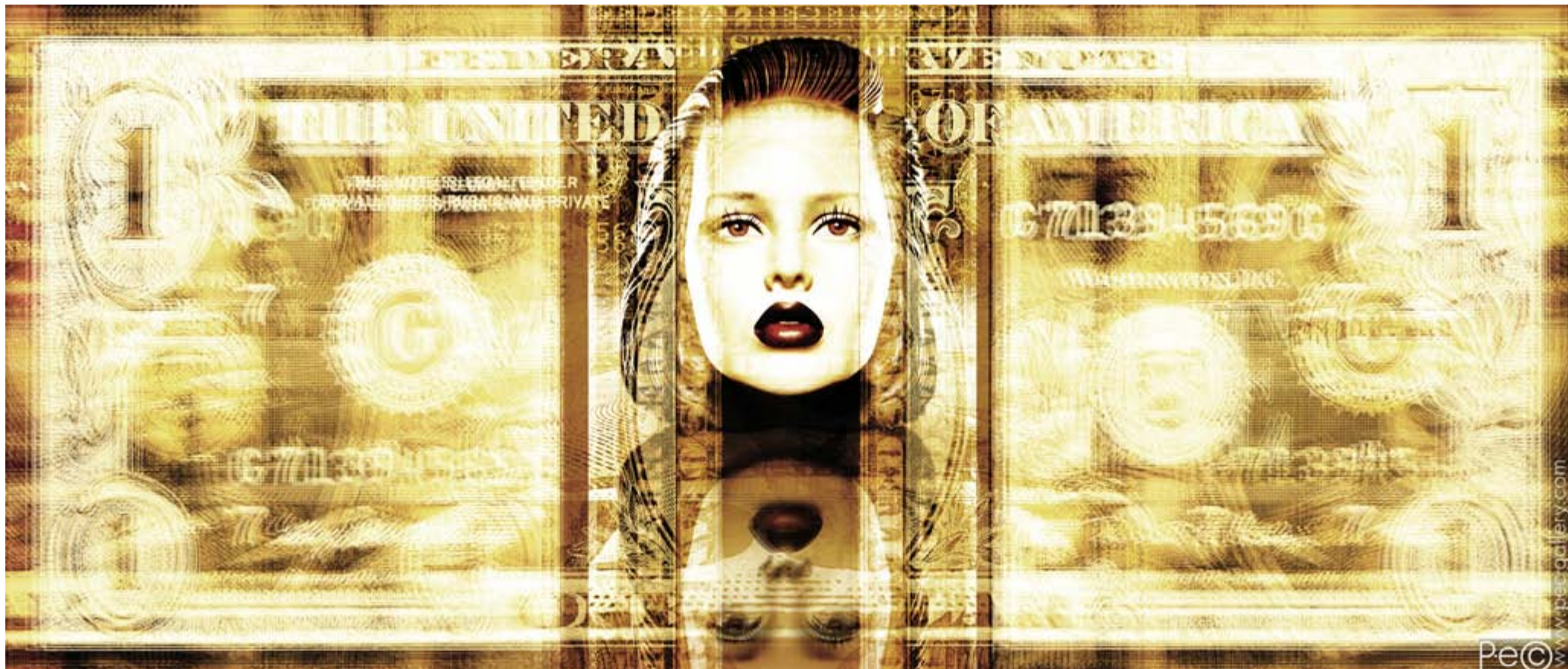
PAPER DOLL 003 (100x42,5 CM.)