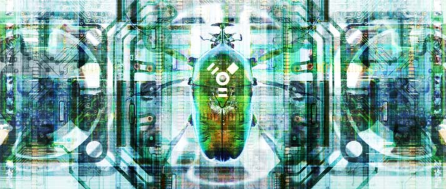
BUG IN THE SYSTEM 003 (150x64CM.)