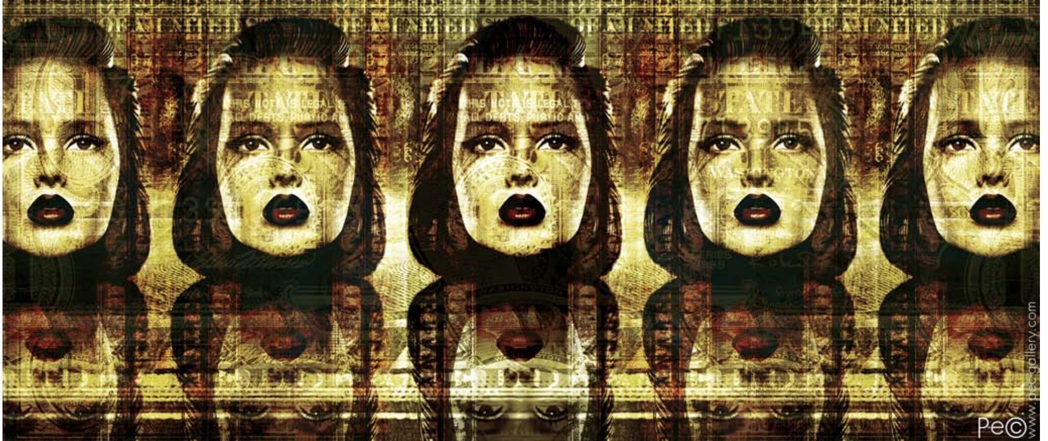
PAPER DOLL 030 (100x42,5 CM.)