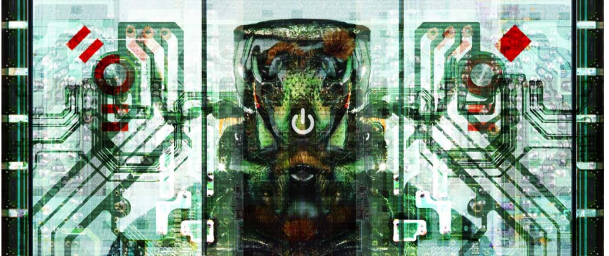
BUG IN THE SYSTEM 007 (150x64CM.)