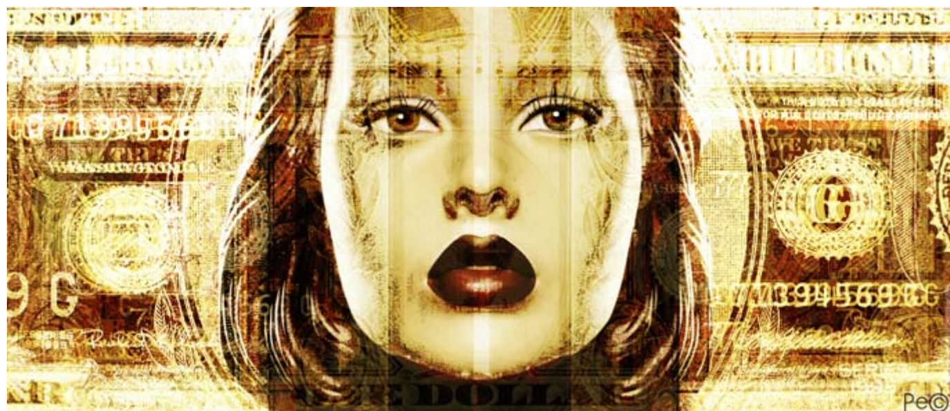
PAPER DOLL 020 (120x51 cm.)