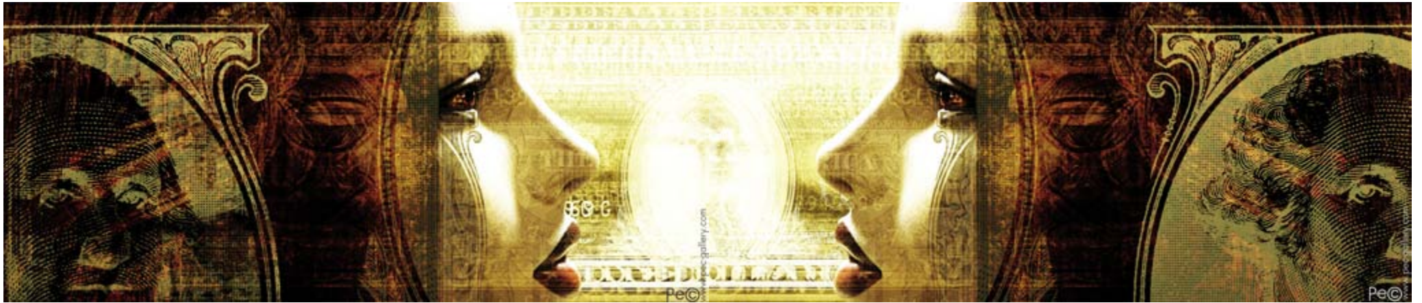
PAPER DOLL diptyque 002 (100x42,5 см.)